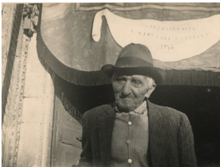
Figura 16 - Iacuitti Francesco Ngiccu Lilli

È probabile che per compilare la prima voce di questa statistica ecclesiastica l'arciprete abbia utilizzato il suo stato delle anime , redatto nell'anno 1881. Tenendolo aggiornato era in grado di fornire rapidamente i totali richiesti.