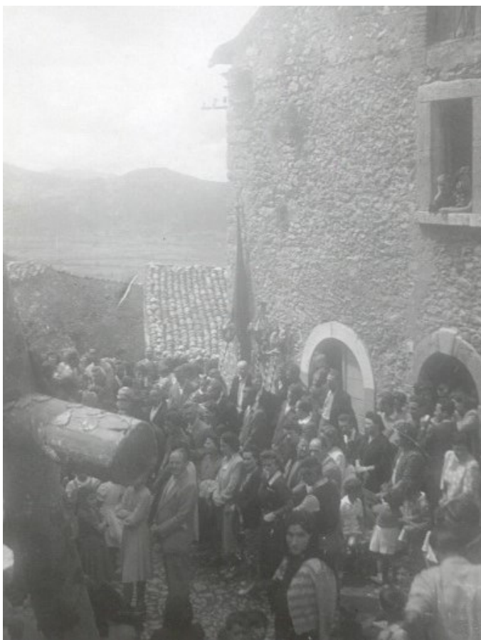
Figura 2 – Piazza SS Salvatore, sosta della processione

Nei censimenti che verranno illustrati di seguito saranno descritte le innovazioni introdotte o le modalità di compilazione in ogni censimento ed a seguire sono riportati i dati d'interesse per Pereto.