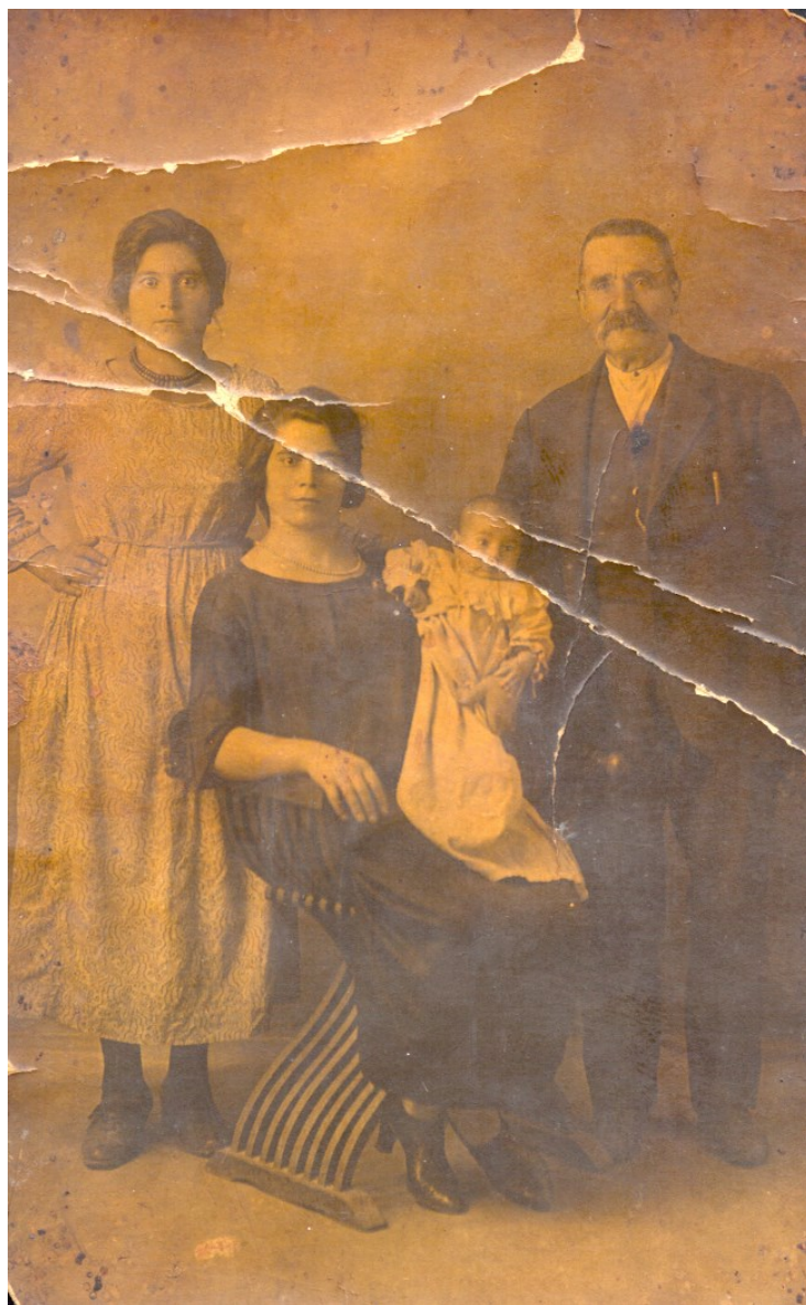
Figura 14 - Battesimo di Cristofari Francesco Francesco 'e Martino

Nella tabella precedente sono mostrati dei dati che furono recuperati all'epoca della mostra 3 con valori che riportano l'andamento della popolazione tra l'anno 1952 fino all'anno 1984.