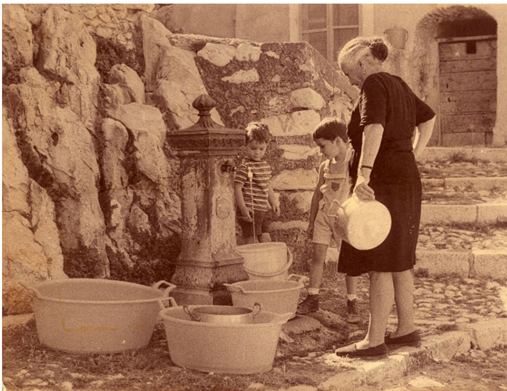
Figura 13 - Fontanella di Pachetto