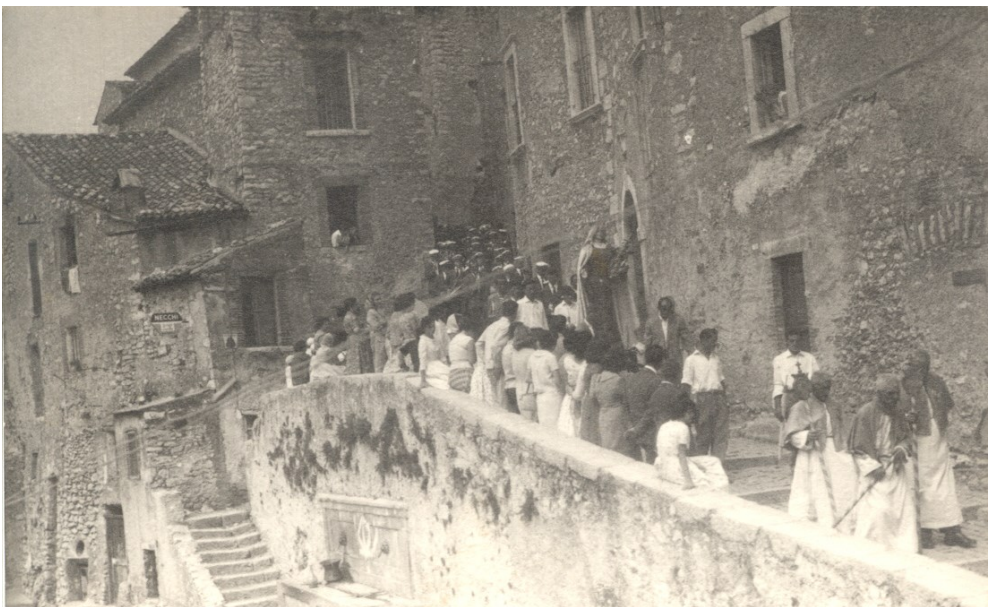
Figura 10 - Piazza della fonte, anni Sessanta

La maggior parte delle abitazioni sono fornite di energia elettrica, ma 245 su 387 (63%) non ha l'acqua potabile ed il gabinetto.