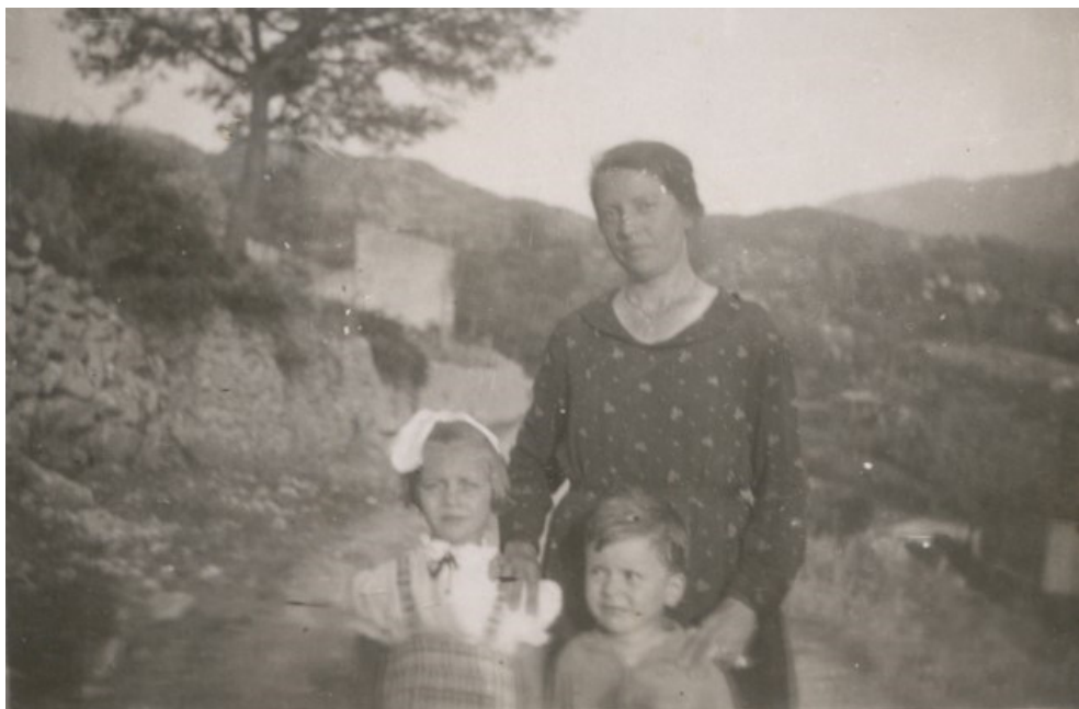
Figura 4 - Via della Fonte vecchia

Pereto era il più popoloso dei tre comuni aggregati.