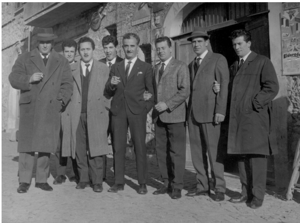
Figura 1 – Amici su corso Umberto I, avanti da Giona

Nella copertina della presente pubblicazione è riportato uno scorcio del paese. È mostrato via di castello nell'anno 1932.