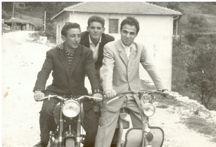
Figura 6 - Via della Fonte vecchia

La popolazione del paese è cresciuta. Le persone assenti forniscono informazioni sugli emigrati, sia verso i grandi centri urbani, sia in stati esteri. Si trovano altre informazioni rispetto ai censimenti precedenti, ovvero quanti presenti negli agglomerati (centri) e quanti in luoghi sparsi.