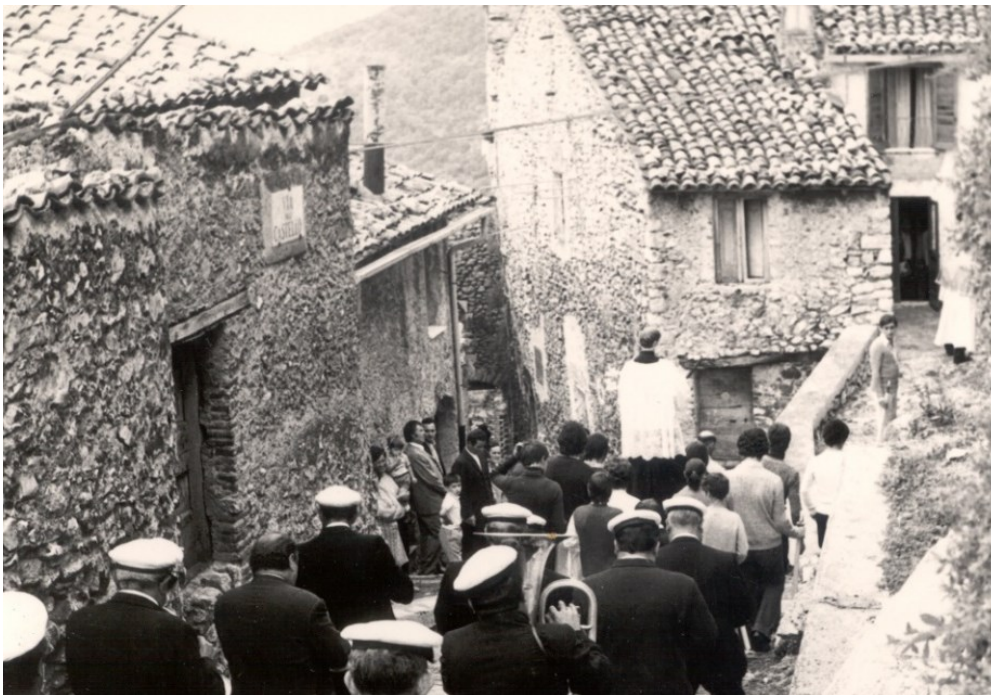
Figura 7 - Via di Castello, anni Settanta

Quello che si nota in questi quattro censimenti è l'aumento della popolazione e degli assenti, dovuti alla migrazione in altre città o nazioni.